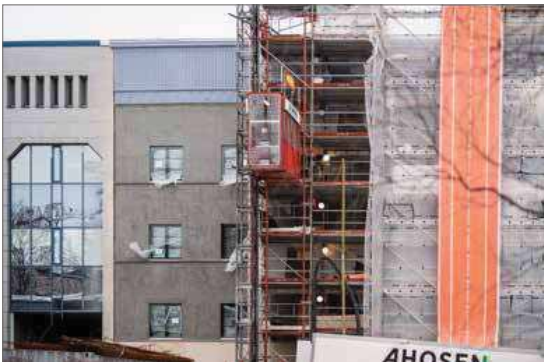
Julkisivun pääväri on kenttäpuvunharmaa. Se oli talon alkuperäinen väri vuonna 1929, kun se valmistui. Katonrajan vaaleansinistä koristefriisiä on kunnostettu.

■ Perusteluna päätökselle KHO huomautti, että varmuudella ei voida todeta, että kauppa ei olisi ollut alihintainen ja ettei se sisältäisi taloudellista hyötyä ostajalle. Lisäksi myynnin kilpailuttamismenettely ei ollut riittävän julkinen ja avoin.