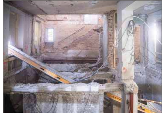
Entinen Kauppahalli Kilpisenkadun sivulla näyttää tällä hetkellä vielä täitä. Palkistojen alla näkyy kellaritiloja.